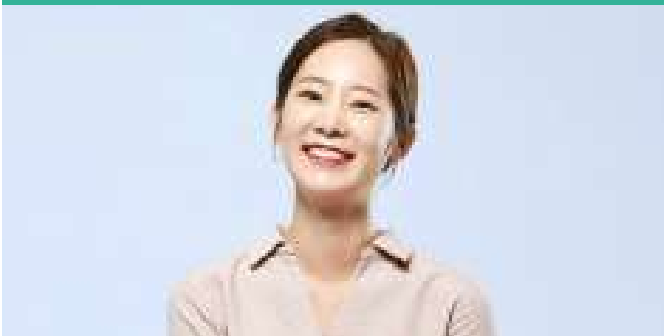
조명 및 주변 환경 좋은 예